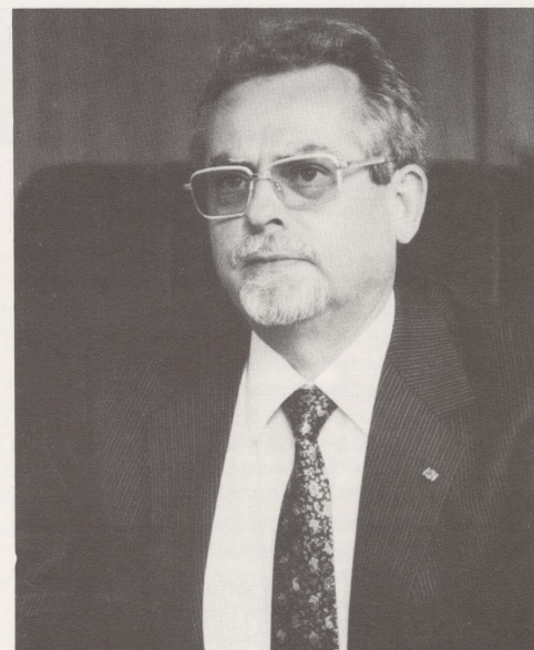
Helmut Pakulat Bürgermeister